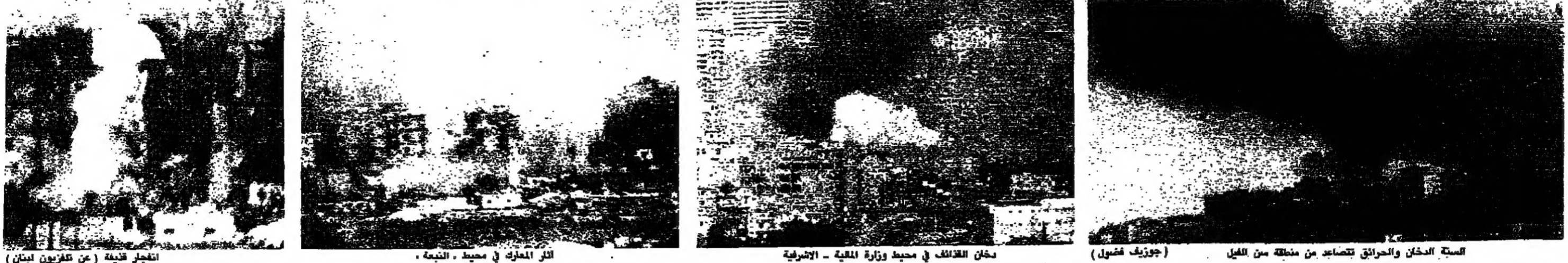
السكران القنص - المخيم في محيط النبعة - المخيم القنص في محيط وزارة المظلة - الاشرفية

الازمة بين فرنسا والهراوي انتهت بتوضيح يحصر انتقاداته الاخيرة بنواب المعارضة الفرنسية